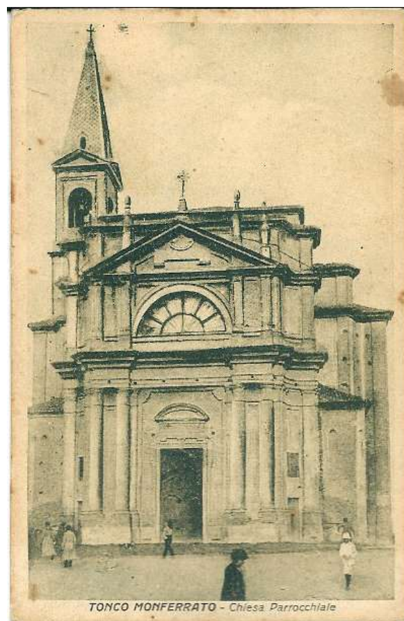
Chiesa con campanile a guglia

Nel 1913 un fulmine colpì la cupola del campanile che crollò e venne successivamente ricostruita.