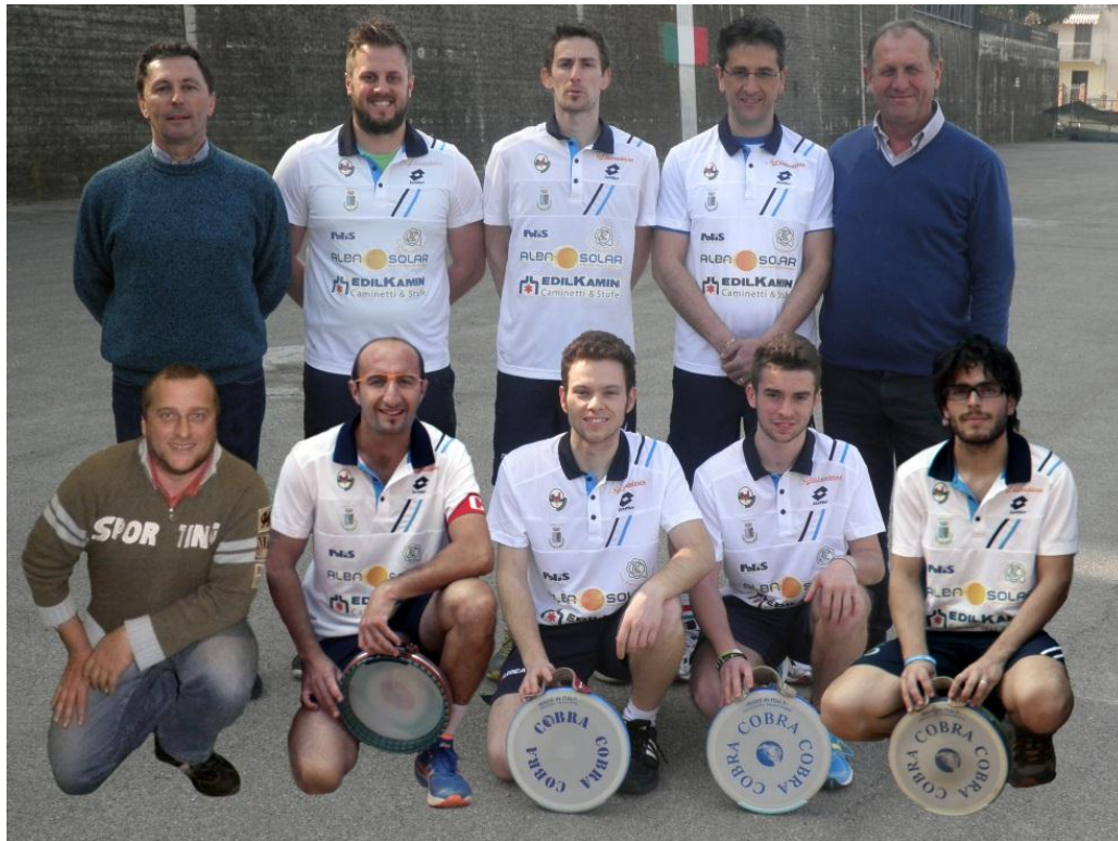
La squadra del Tonco – Serie A a muro

La stagione del Tonco in Serie A sarà probabilmente decisa dalle ultime partite di campionato che decreteranno le quattro squadre che accederanno alla fase finale.