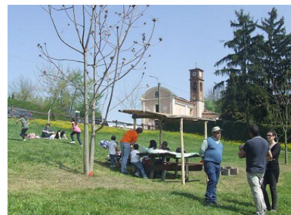
Inaugurazione area pic-nic, rione Annunziata