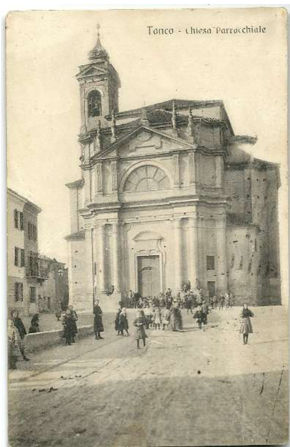
Chiesa prima del crollo della cupola