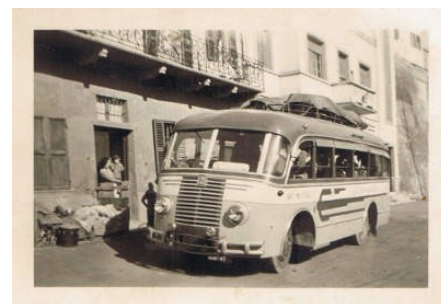
La seconda corriera de La Bersagliera. Foto scattata dal padre di Angelo Valpreda nella piazza del paese.