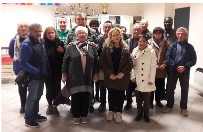
Corso di avvicinamento al pc gratuito organizzato da Comune, Senza Fili Senza Confini e Parrocchia - 2019