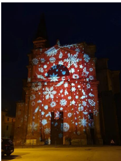
Chiesa illuminata per Natale