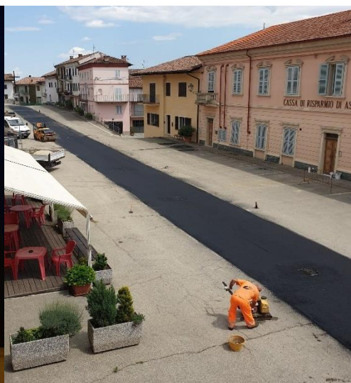
Asfaltatura P.za Vittorio Emanuele II