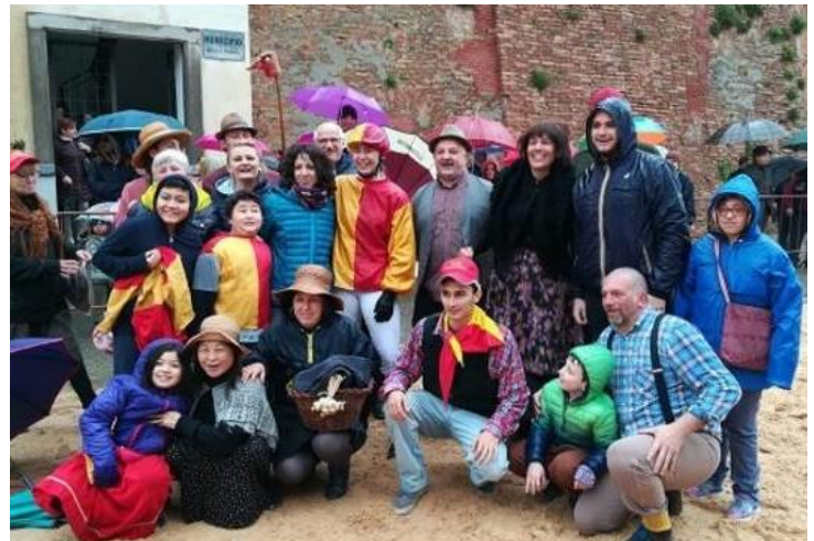
Festa del Pitu 2019 vinta dal rione Annunziata, per la prima volta fantini tutti di sesso femminile