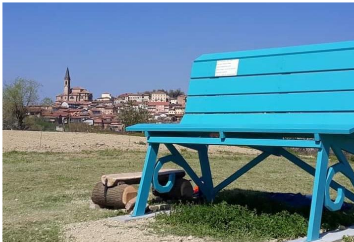
Panchina Gigante 'La Tunchina' inaugurata il 30 marzo 2019