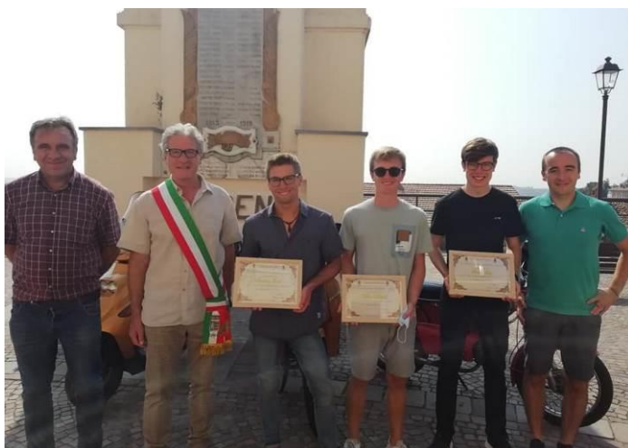
Tre giovani ragazzi in motorino dalla Germania a Tonco